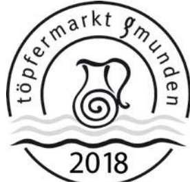
FOTO IHRER TÖPFERWARE